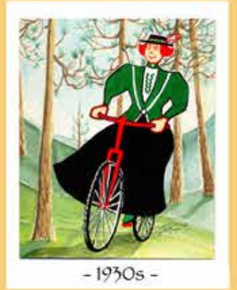
- 1930s -