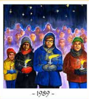
- 1989 -