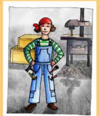
- 1940s -