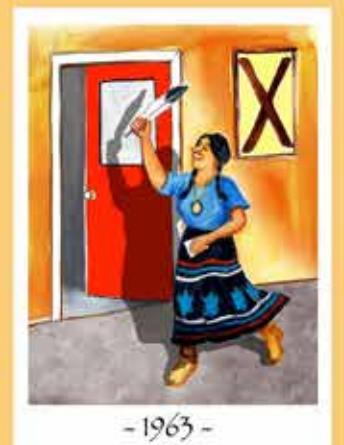
- 1963 -