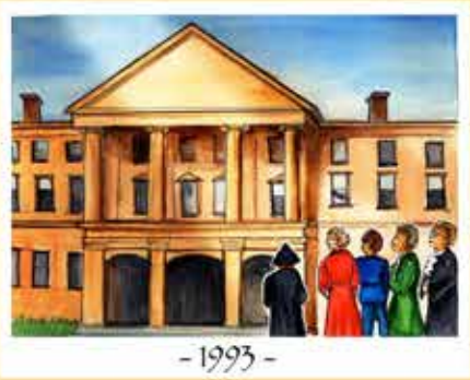
- 1993 -